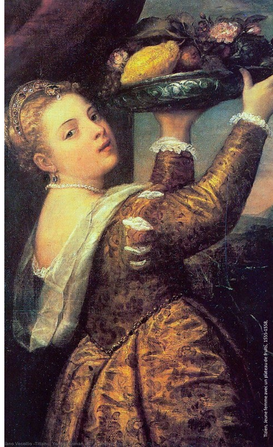
Titien, Jeune femme avec un plateau de fruits, 1555-1558.

Les inscriptions aux cours en replay sont closes une semaine avant la fin de la période de diffusion.