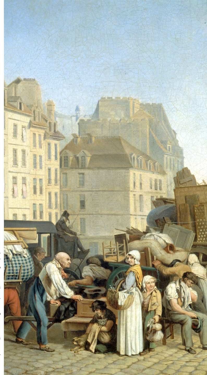
Louis-Léopold Boilly, Les Déménagements (détail), musée Cognacq-Jay

Les inscriptions aux cours en replay sont closes une semaine avant la fin de la période de diffusion.