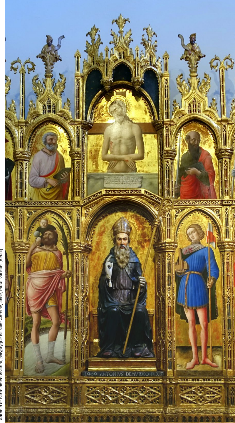
Antonio et Bartolomeo Vivarini, polyptyque de saint Antoine, abbé, musei vaticani (détail)

Les inscriptions aux cours en replay sont closes le 24/08/2024, soit une semaine avant la fin de la période de diffusion.