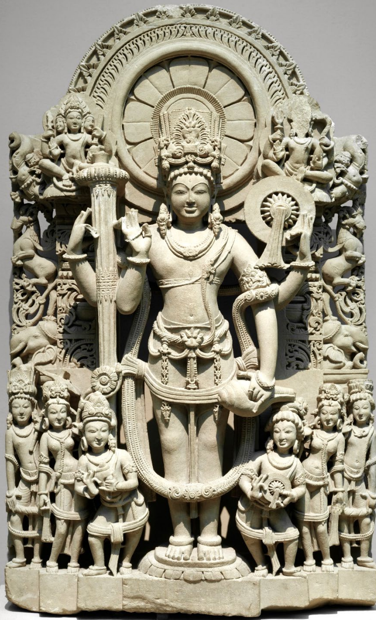
Vishnu, metropolitan museum, New-York

En cas de nécessité, des modifications de calendrier, de programme et d'intervenants peuvent survenir.