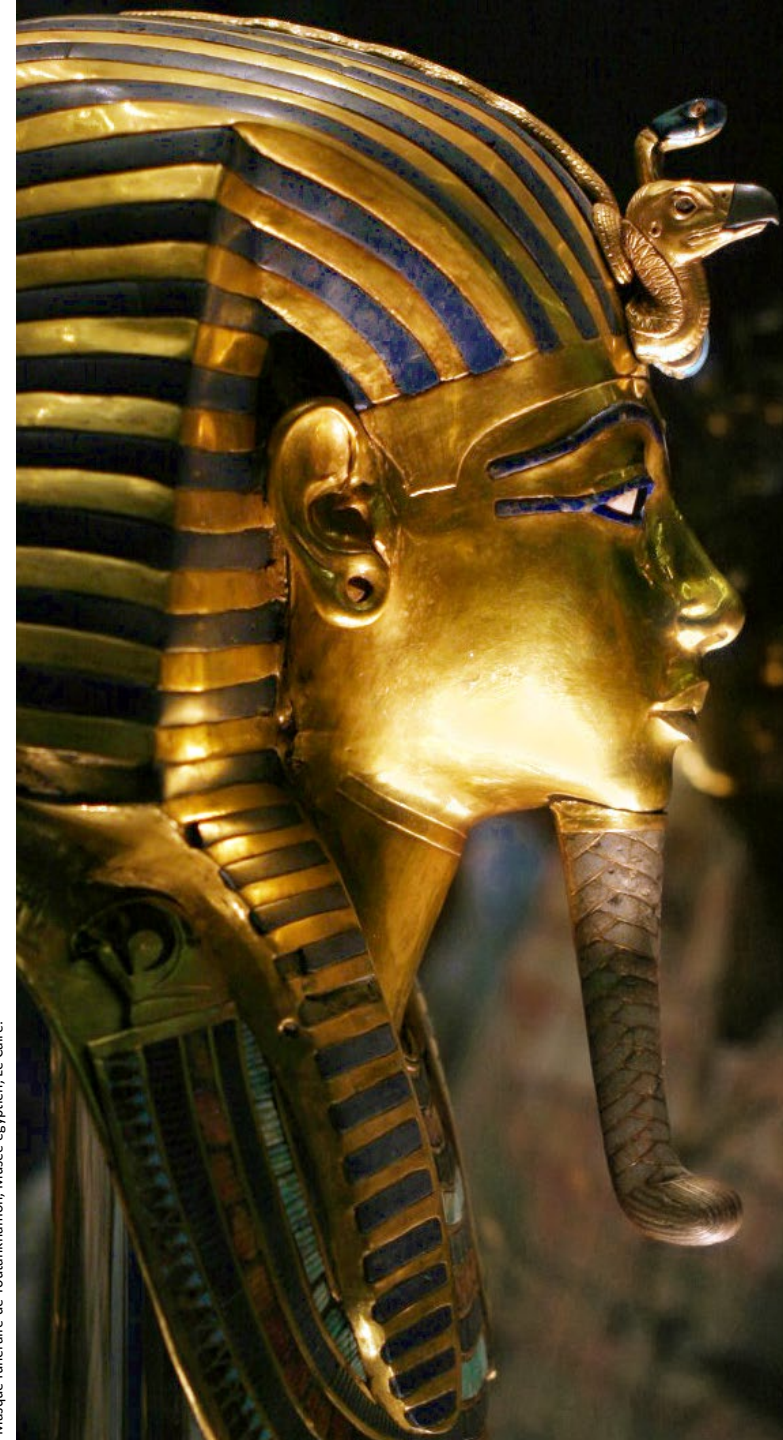
Masque funéraire de Toutânkhamon, Musée égyptien, Le Caire.

En cas de nécessité, des modifications de calendrier, de programme et d'intervenants peuvent survenir.