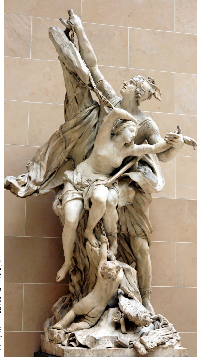
Pierre Puget, Persée et Andromède, musée du Louvre, Paris

En cas de nécessité, des modifications de calendrier, de programme et d'intervenants peuvent survenir.