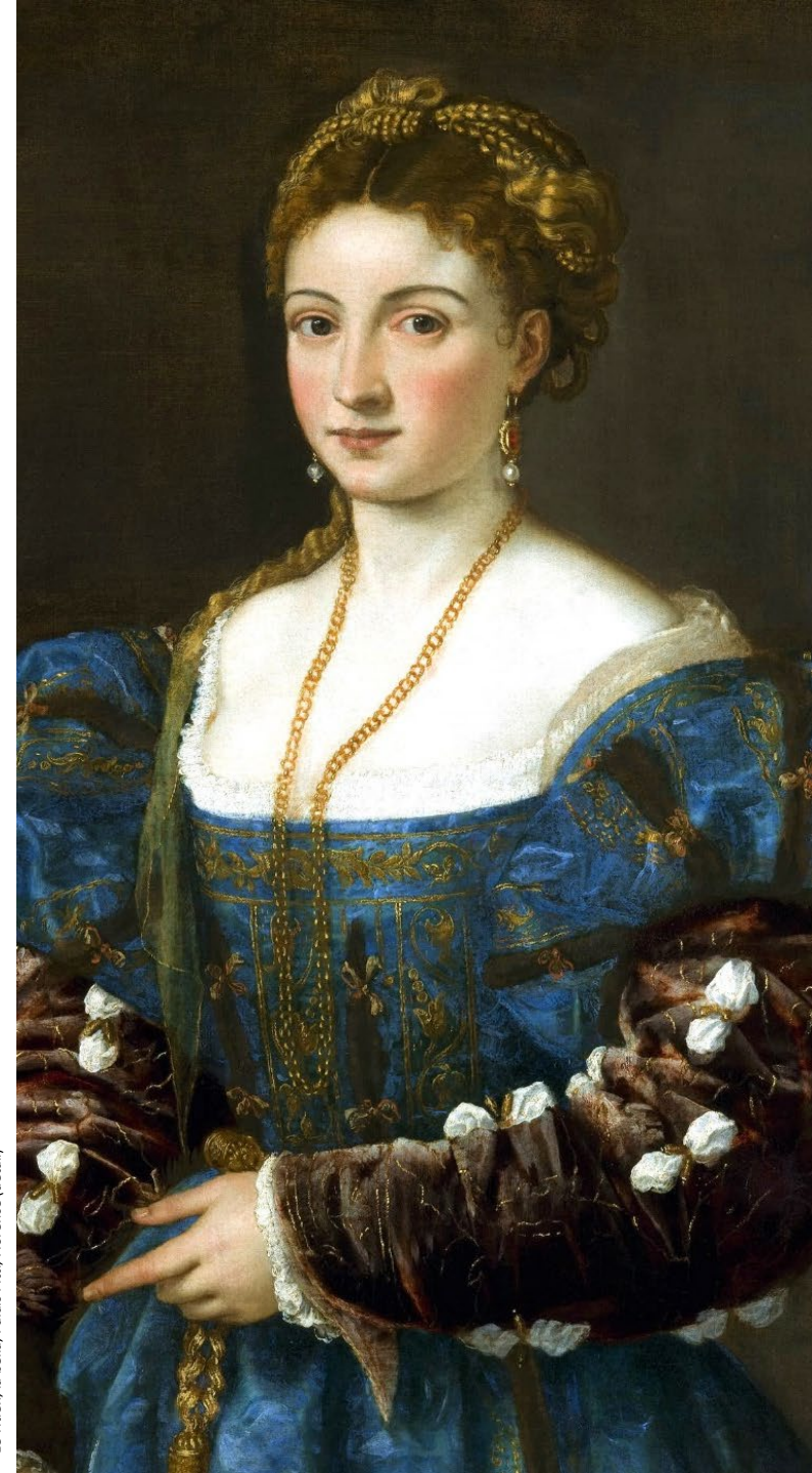
Le Titien, la bella, Palais Pitti, Florence (détail)

En cas de nécessité, des modifications de calendrier, de programme et d'intervenants peuvent survenir.