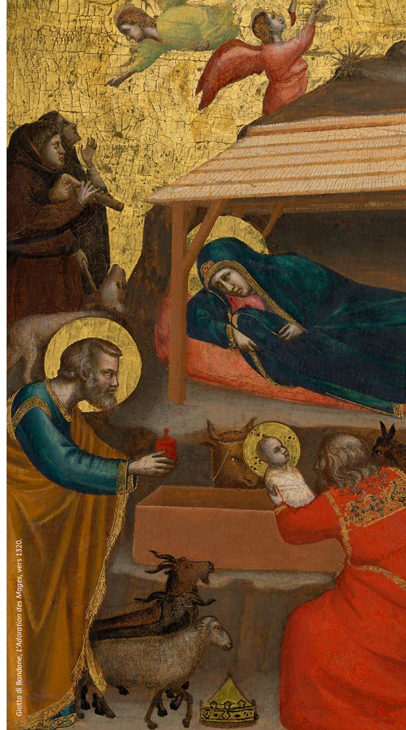
Giotto di Bondone, L'Adoration des Mages, vers 1320.

En cas de nécessité, des modifications de calendrier, de programme et d'intervenants peuvent survenir.