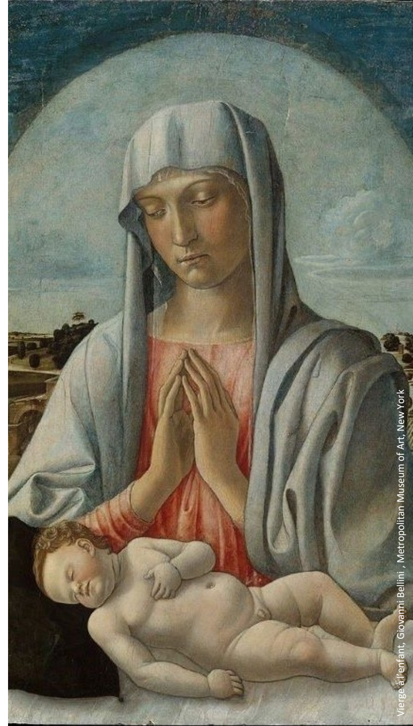
Vierge allaitant, Giovanni Bellini, Metropolitan Museum of Art, New York

En cas de nécessité, des modifications de calendrier, de programme et d'intervenants peuvent survenir.